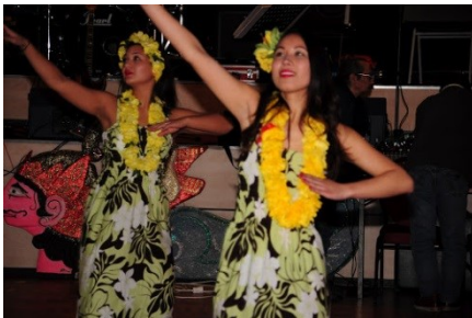
februari 2012

In 2012 heeft Maeva al een spetterende show gegeven op onze benefietavond. Toe ze hoorden van Dance4Friends hebben ze spontaan aangeboden om weer mee te werken!